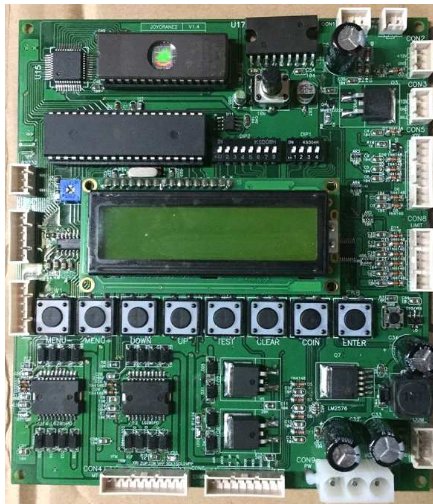
그림 8) PCB사진