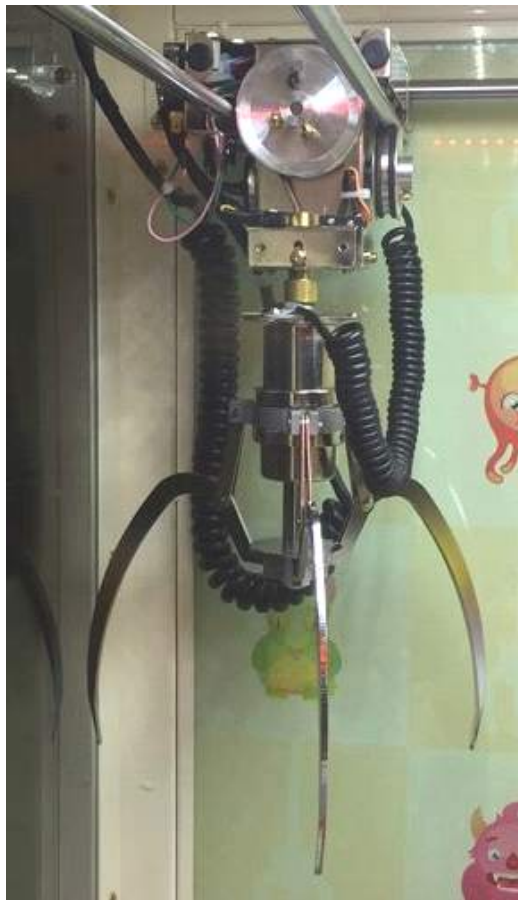
그림 6) 집게발 사진