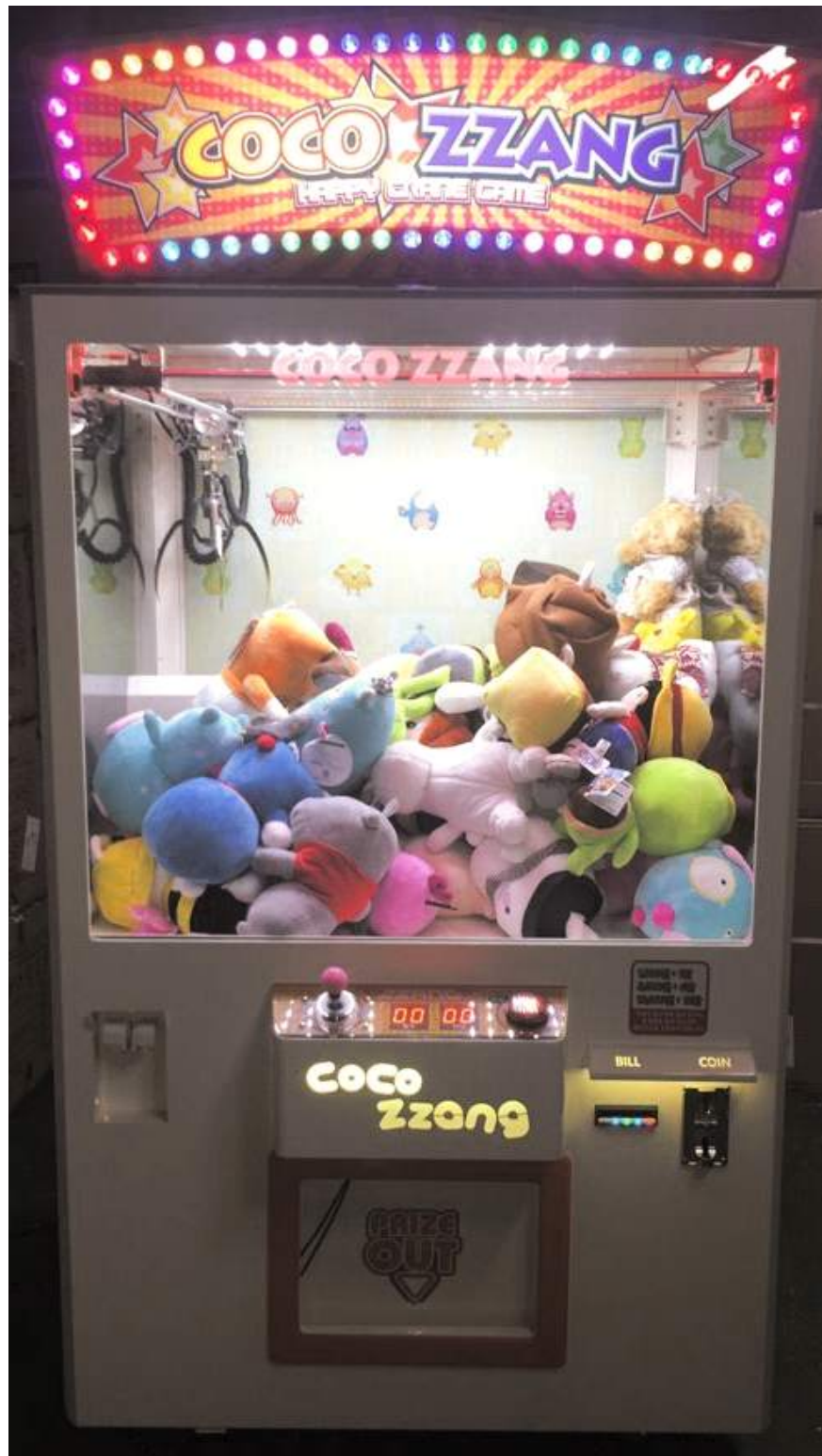
그림 1) 정면사진