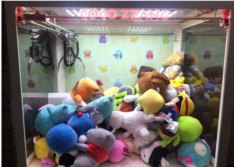
그림 7) 내부사진