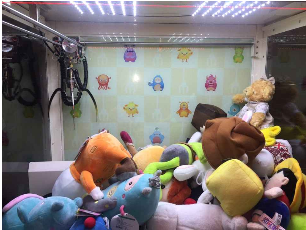
그림 0) 사용하는 경품의 예시