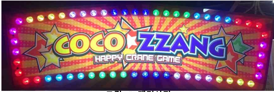
그림 4) 제명사진