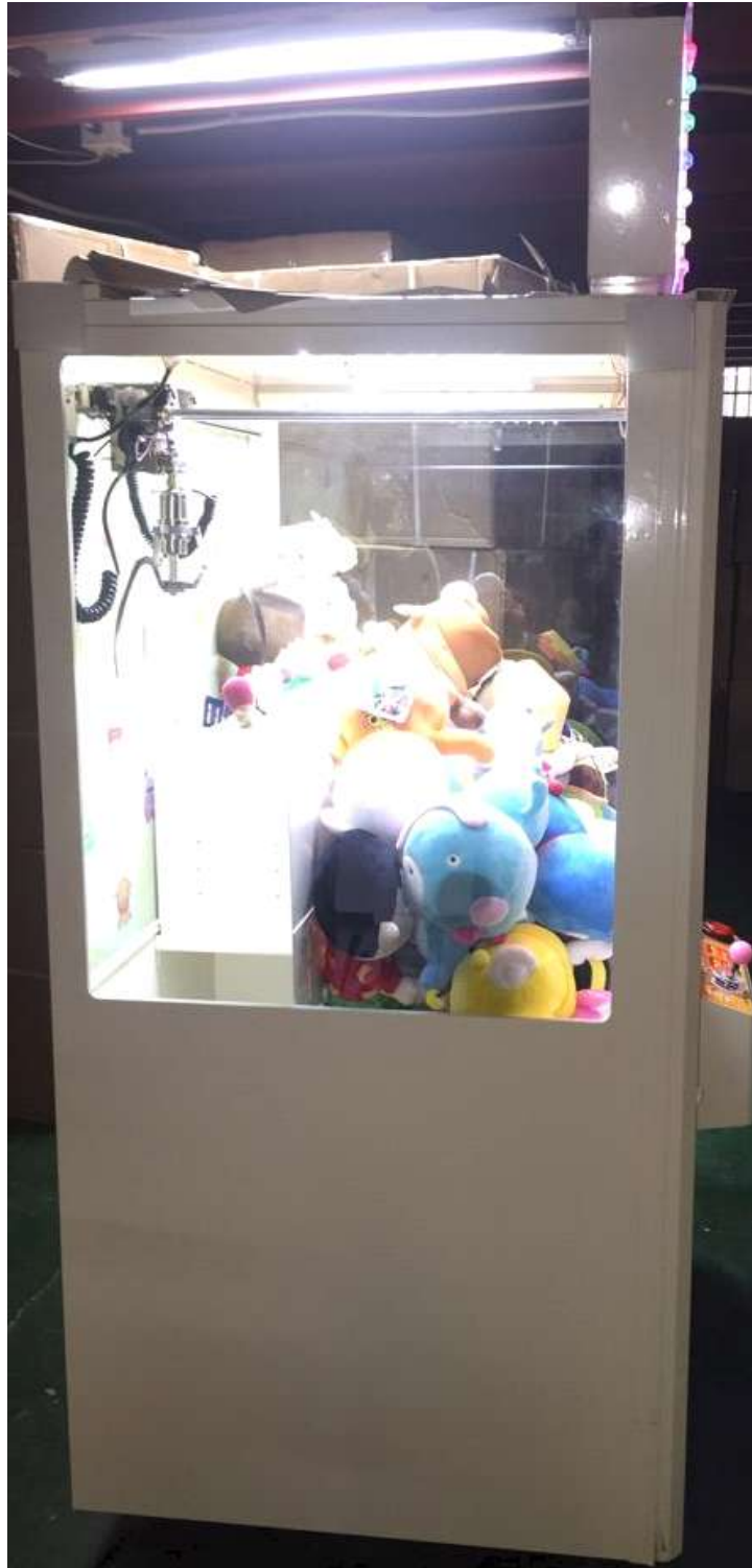
그림 3) 좌측사진