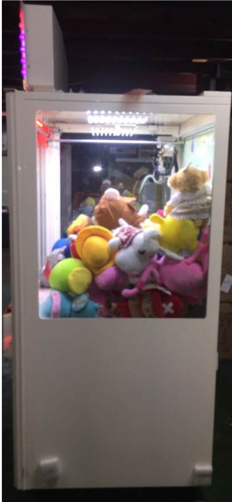
그림 2) 우측사진