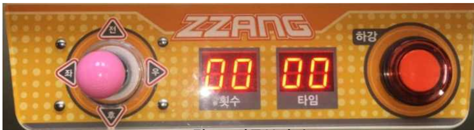
그림 5) 버튼부사진