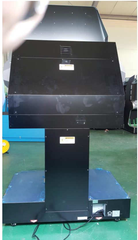
<기기 후면 사진>