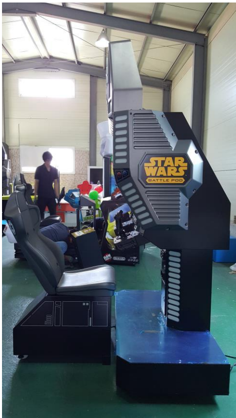
<기기 측면 사진 1>