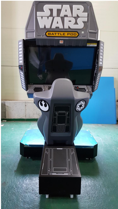
<기기 전면 사진>