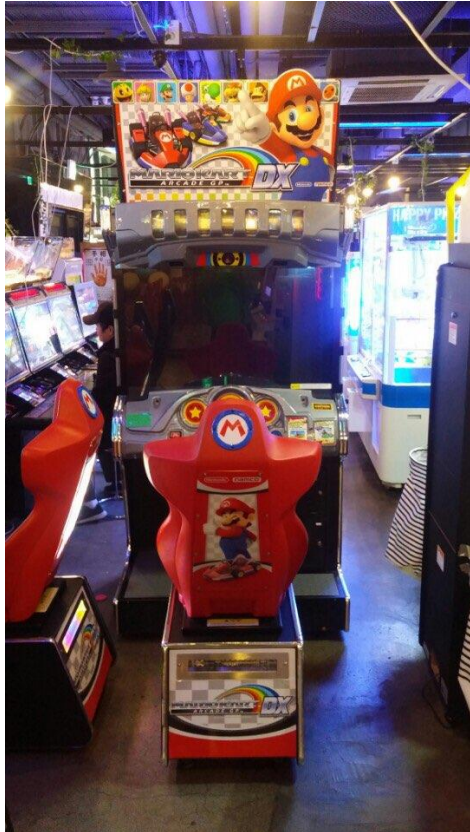
<기기 전면 사진>