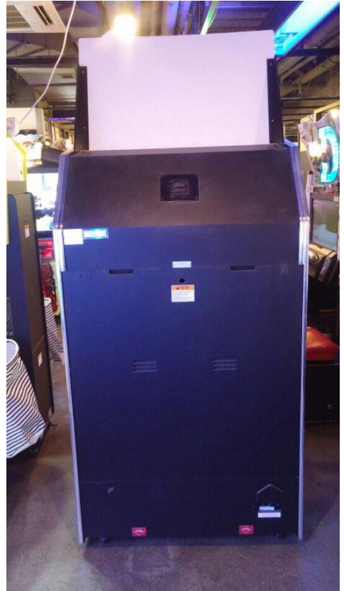
<기기 후면 사진>