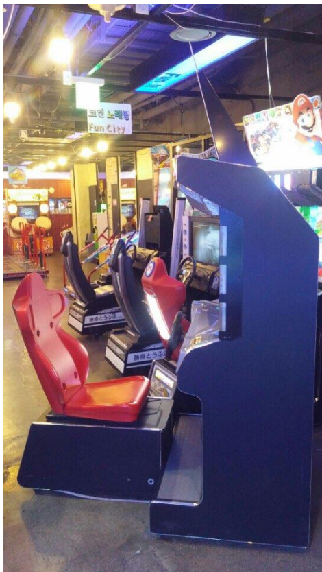
<기기 측면 사진 1>