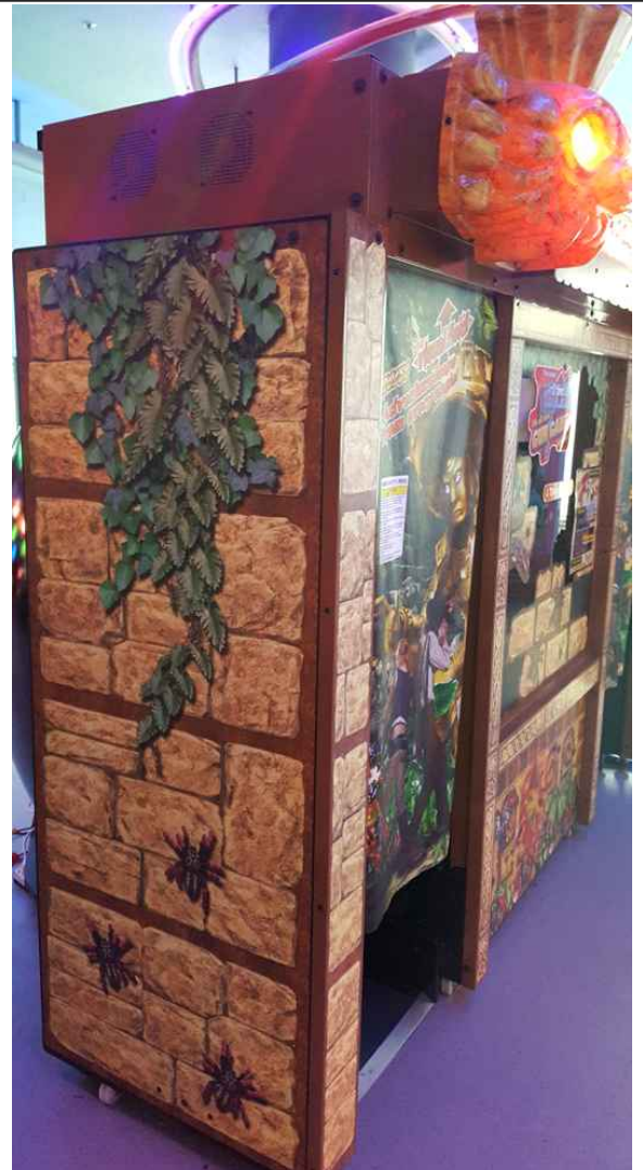
좌측 옆면 사진