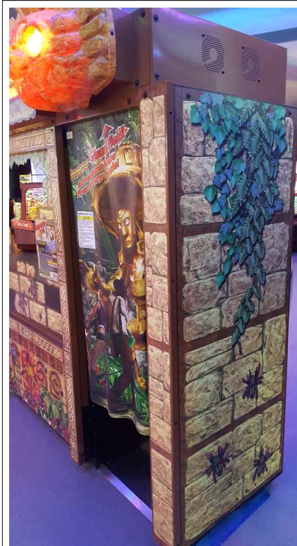
우측 옆면 사진