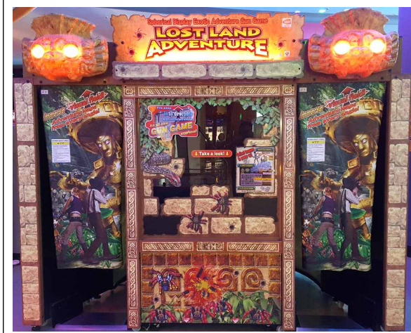
게임 정면 화면